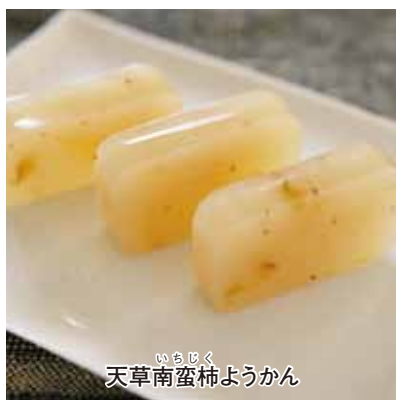
天草南蛮柿ようかん