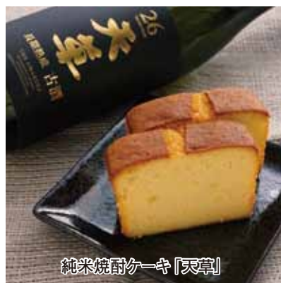
純米焼酎ケーキ「天草」