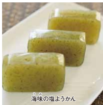
海味の塩ようかん