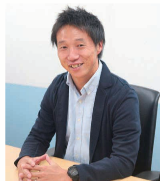
株式会社アクティビティジャパン COO

沖縄スポーツ観光誘客促進事業、山形県インバウンドセミナー、日本海きらきら羽越観光圏(秋田/山形/新潟)着地型商品販売PRセミナー、秋田犬ツーリズム集客セミナー、JNTOデジタル時代に対応したコト消費促進セミナー等、全国各地で誘客促進事業やセミナー講演を行っている。